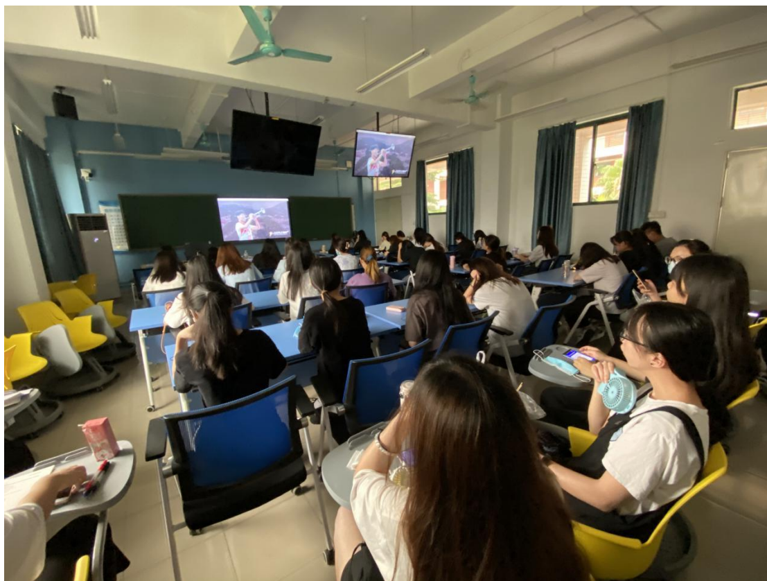
师生线上参加“青年红色筑梦之旅”活动全国启动仪式照片