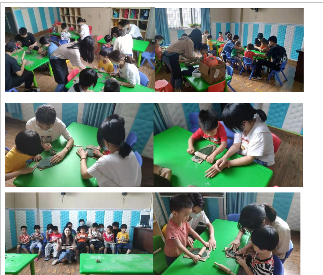
心课堂团队 2021年7月3日