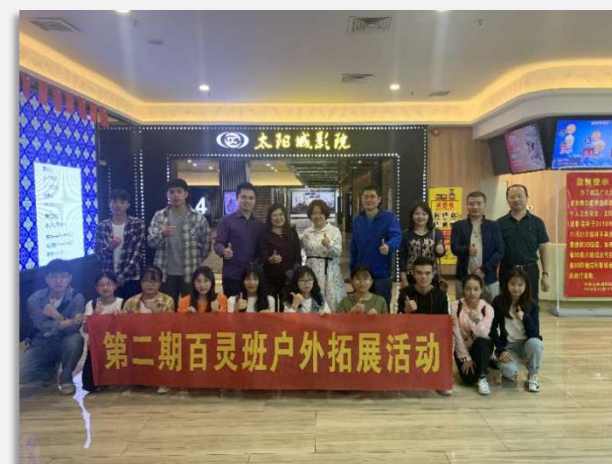
实习生参加爱国观影活动