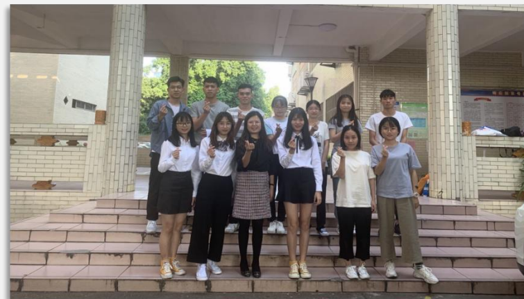
授课老师与学员合影