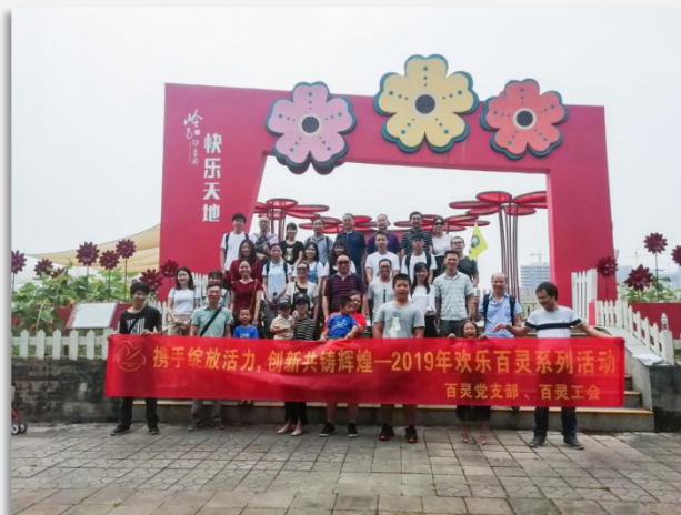
实习生参加公司旅游