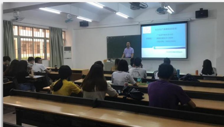
曹国范 安全管理知识