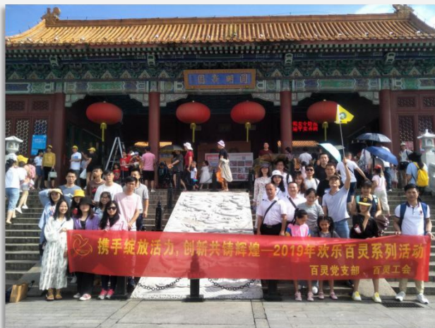
实习生参加公司旅游