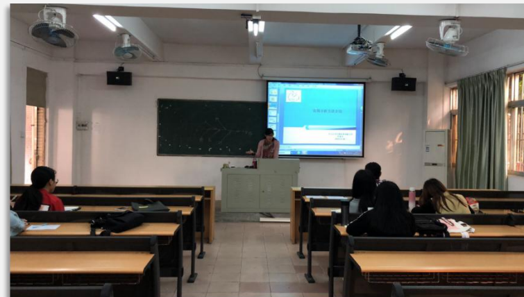
罗素芬 药品检验知识