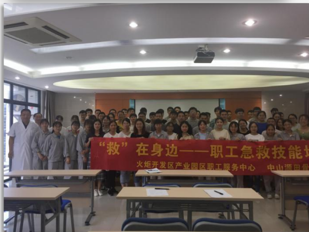
实习生参加急救技能培训