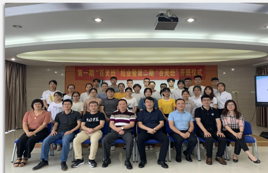
第一期百灵班结业暨第二期百灵班开班仪式