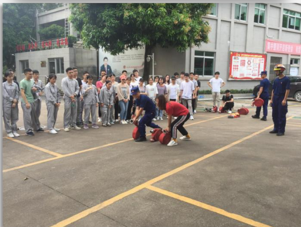
实习生参观消防大队