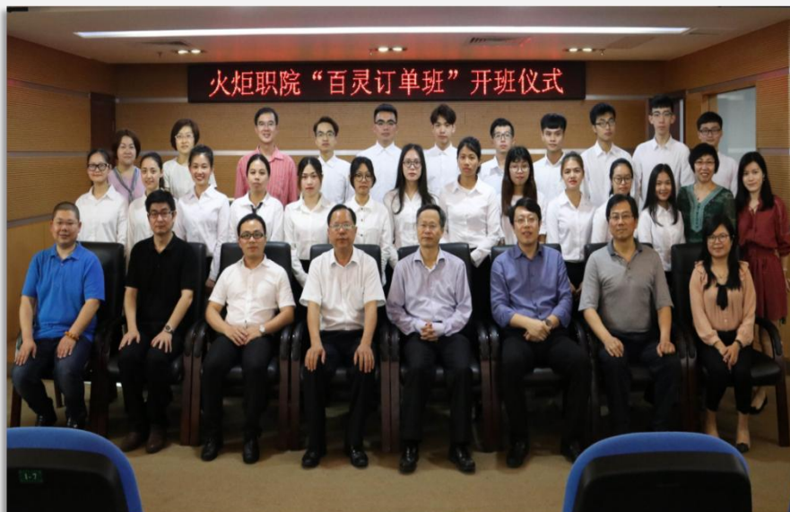
第一期百灵班开班仪式