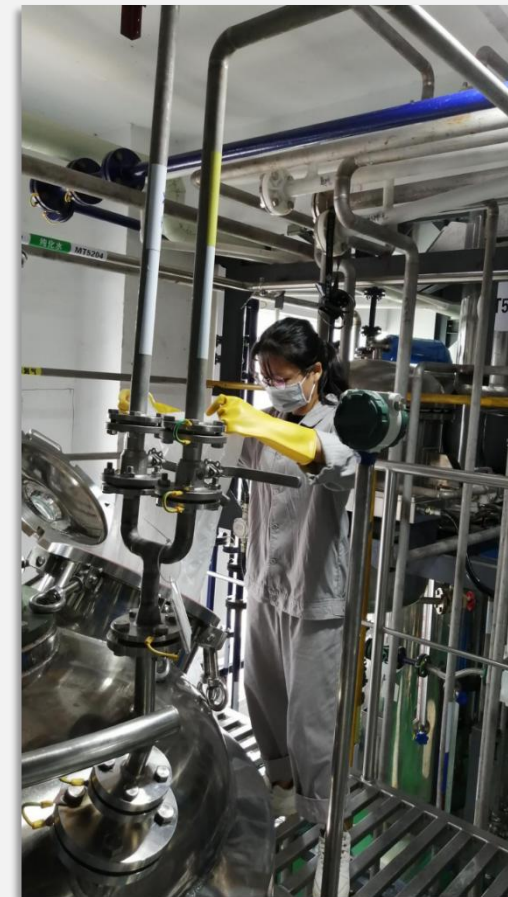
百灵班学员实习现场