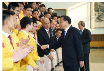
李克强会见世界技能大赛中国选手

梁智滨还先后获得 CCTV2017 年度三农人物、广东省五四奖、广州市技术能手等称号，并获得国务院总理的亲自接见。