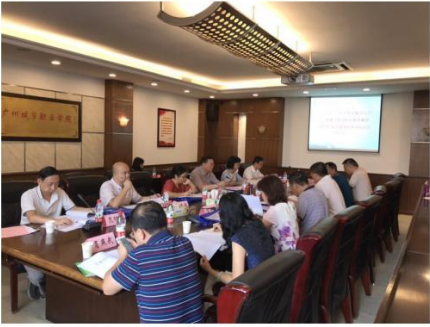
学院组织专家开展示范职教集团建设方案和任务书论证会

种实用新型的花束包装盒》、生产工业革新类项目《墨兰水培技术的工艺革新》代表广东省参加由共青团中央、教育部等联合主办的 2018 年“挑战杯--彩虹人生”全国职业学校创新创业大赛分别获得二等奖、三等奖。