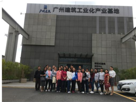
智慧学院成员单位开展专业建设互动