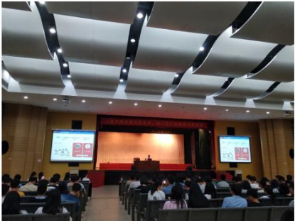
合作各方共同参与的“现代城市建设新技术、新工艺”高新技术研修班